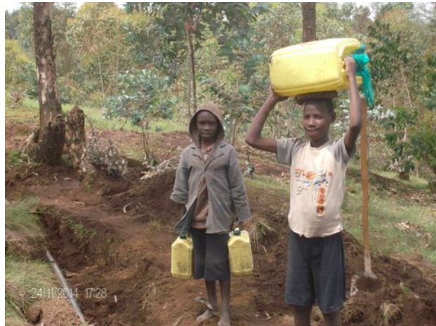
Wasserholer an der borne fontaine