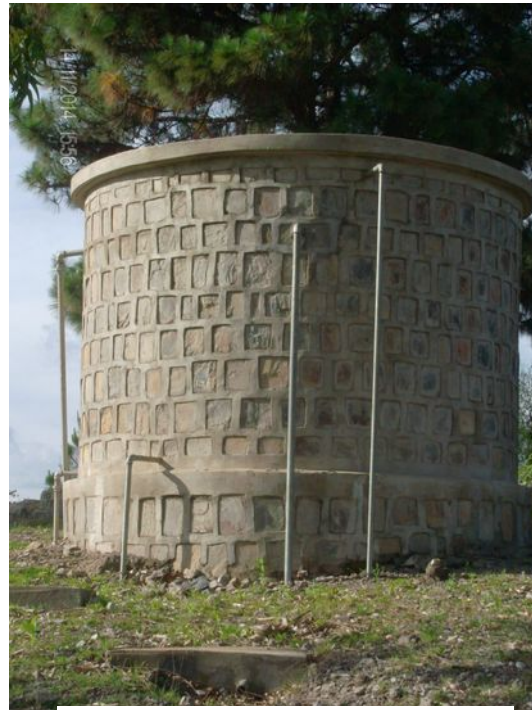
Reservoir 60 m höher

Die Pumpe ist sehr servicearm und liefert permanent Tag und Nacht 3 l sauberes Quellwasser pro Minute in das vorhandene Reservoir. Das reicht auch noch für die Nachbarschaft der Umgebung.