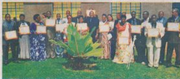
Après la remise des certificats, le chef de l'Etat a posé pour une photo de famille avec les administrateurs des vingt premières communes

Selon le chef de l'Etat, ces résultats serviront au gouvernement de thermomètre pour se faire une idée précise sur le degré de réussite de sa politique de décentralisation et serviront également de catalyseur pour une plus grande implication dans la responsabilisation de tous les acteurs au niveau tant central que local. « Ils encourageront les plus performants à aller de l'avant et donneront un nouvel élan aux moins actifs qui s'appliquent davantage à mettre